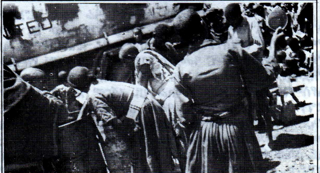
ለሰፈራዎቹ ውሃ ከቡቴ ሲታደል

ማፍራት፣ በሰው ርዳታ ምሥራቅ ወለጋ ላይ የደረሰባቸውን ችግር መግለጥ የሚችሉ ሰዎችን ማግኘትና አመቺ ቦታ ይዞ ማነጋገር አስፈላጊ ነበር። ይኸ፣ ይኸ ጊዜውን በላው። ዛሬ ሁኔታዎች ተብብሰው ወይም ተሻሽለው ለሆነ ይችላል። አላውቅም። በወቅቱ ግን ከሠፈራው ጣቢያ በየዕለቱ ሁለትና ሦስት ራሃ ይወጣ ነበር። የሚሞቱት ሕጻናት ናቸው። ቡሬ እንኳን እንግዳ ልታስተናግድበት ለራሷም የምትጠጣው ውሃ የላትም። ለሠፈራዎቹ ውሃ በቡቴ እየመጣ ሲከፋፈል አይቻለም። የሠፈራው ጣቢያ የመጻጻጃ ሁኔታ ለወረርሽኝና ለበሽታ መቀስቀስ በሚያመች ሁኔታ የትም ነው። ያስፈራል። በዚህ ላይ የአማራን ትምህርት ለመዋጋት የቆሙት የክልል ሦስት ባለሥልጣናት ለአዝዚህ ከወለጋ ተቀጥተው ጉጃም ለገቡት መከረኞች የሚራራ ልብ ያላቸው አይመስልም። ዘግይተው እየመጡ ለአሉት የወለጋ ተፈናቃዮች ዕርዳታ እንደደረሱ አይሰጥም። «እናንተማ ከጠቀቻችሁንና እህላችሁን ስትሸጡ ቆይታችሁ የመጣችሁ ስለሆነ ለእናንተ ዕርዳታ አንሰጥም» እያሉ እንደሚጨከባቸው ስደተኞቹ ያስረዳሉ።